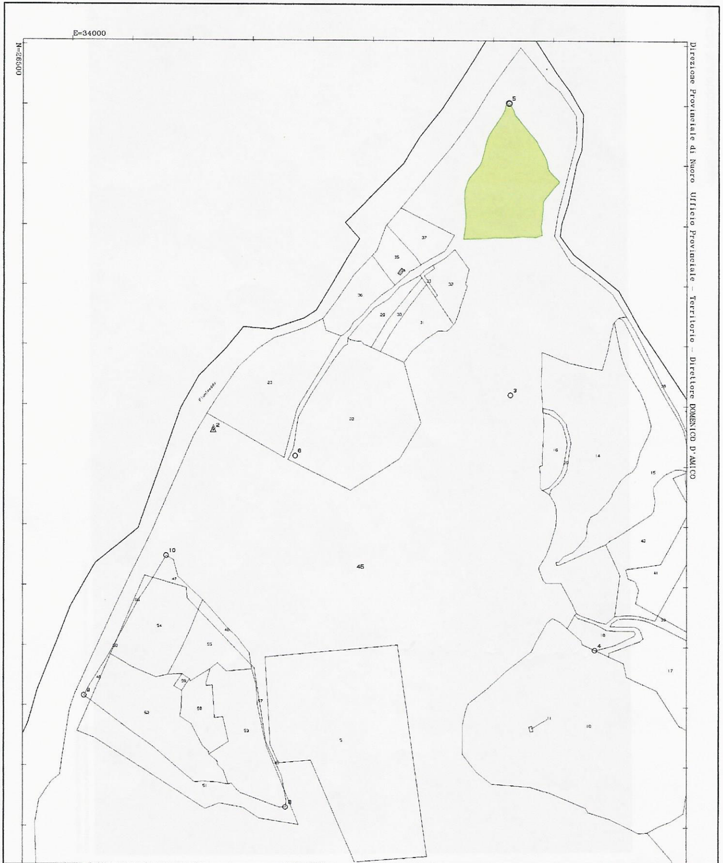
Cessione in affitto o proprietà di terreni sclassificati da regime demaniale in località terreni Oddoene Allegato a richiesta subentro pratica n. 405