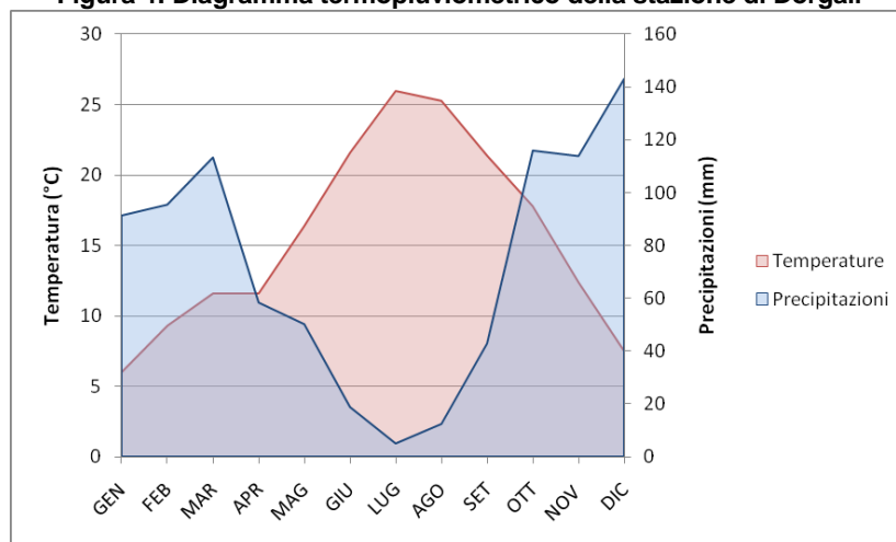
Figura 4: Diagramma termopluviometrico della stazione di Dorgali

L'analisi dei dati termopluviometrici colloca la zona in esame nella fascia di territorio caratterizzato dal clima mediterraneo semiarido. In particolare, si annotano estati calde scarsamente piovose con una ripresa delle precipitazioni verso Settembre-Ottobre che si susseguono con intensità irregolare fino a Marzo-Aprile con un massimo delle medie mensili tra Dicembre e Febbraio. Le precipitazioni nevose, dovute alle masse di aria fredda provenienti dai quadranti nord-orientali, sono frequenti e persistenti nella fasce montuose dove si raggiungono le quote più elevate.