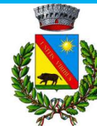
Comune di Urzulei